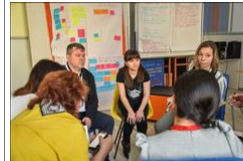
Процесс обучения и обсуждения