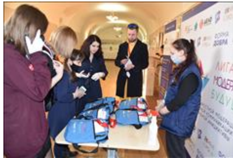
Раздаточные материалы Участникам предоставлены брендированные раздаточные материалы, экипировка.