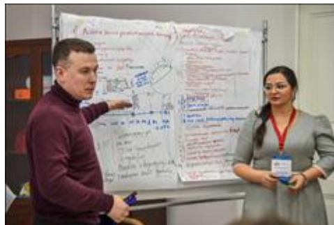
Презентация дорожной карты В финальный день обучения группа разработчиков презентовала дорожную карту создания сообщества и сети клубов Ценностной модерации - Лига модераторов будущего - команде проекта.