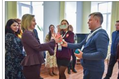
Тренинговый формат Участники во время обучения освоили активные формы работы со студентами.