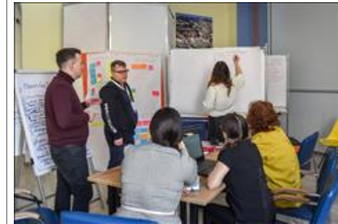
Дорожная карта Участниками сформирована дорожная карта реализации проекта в регионах, создания школ и клубов ценностной модерации и доверительной коммуникации.