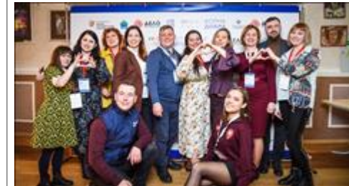
Участники интенсива, 2 день

На фото - региональные координаторы и федеральные эксперты на интенсивном семинаре-тренинге «Ценностная модерация и игротехника: драйверы социальной активности молодежи» в г.Санкт-Петербург 9 -13 апреля 2021 года.